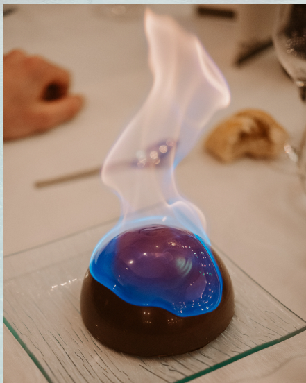
Dessert signature - dôme chocolat flambé surprise

Une destination pour toutes les saisons et tous les budgets.