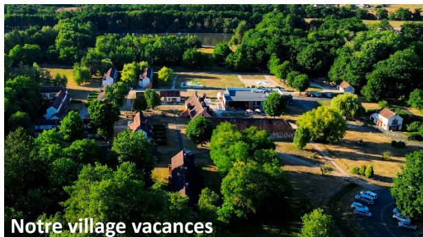
Notre village vacances

QF1 : <10000 / QF2 : <15000 / QF3 : > 15000 QF2 : -10%; QF1 : -18%. Calcul du quotient familial = Revenu fiscal / nombre de parts.