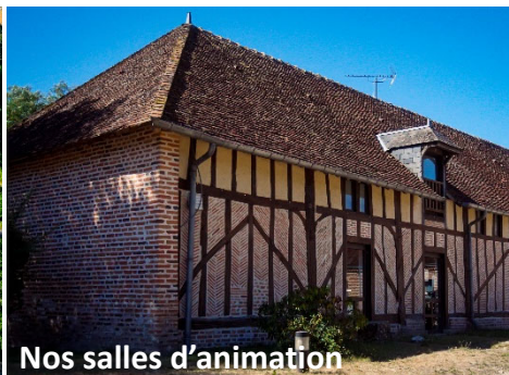
Nos salles d'animation