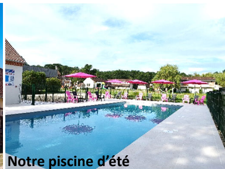
Notre piscine d'été