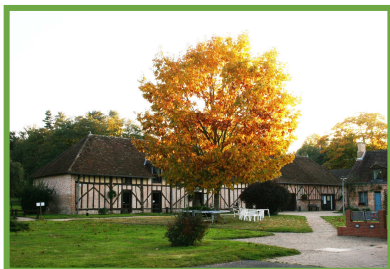
LE VILLAGE VACANCES

Vous profiterez de moments de convivialité. Vous apprécierez notre région, le calme et l'authenticité de notre domaine, la qualité de la restauration, avec nos spécialités.