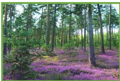
FORÊT DE LANDE